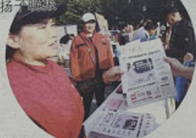
工作人员热情地向读者介绍扬子晚报

“风调雨顺，扬子伴我行”。承载老读者的记忆，见证年轻一代的成长，展望未来社会的发祥脉络……在电子阅读盛行的时代，一份散发着墨香的扬子晚报，它所具备的阅读仪式感，能给你带来无可替代的“仪式感”享受，值得您拥有。创刊近35年的扬子晚报，期待您在新的一年里继续订阅。 扬子晚报/家中新闻记者 杨鑫