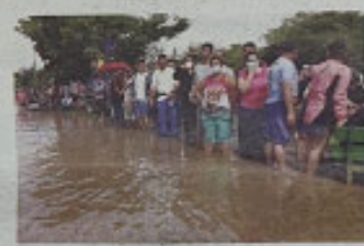
居民“抢购”物资。中国防疫仍将持续,但多重受累严重,截至25日的60人死亡,数千人感染,大量民众建筑和道路封锁,还有公共图书馆等被关闭。新华社发