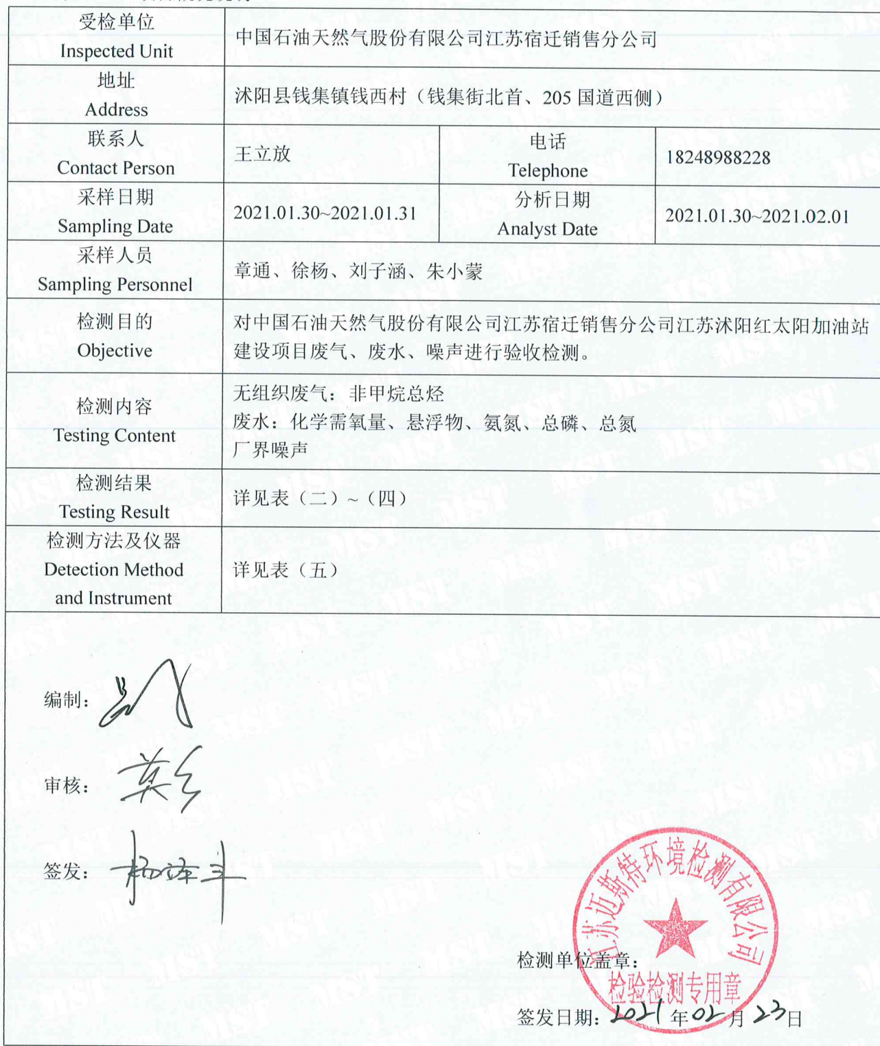
表 (一) 项目概况说明