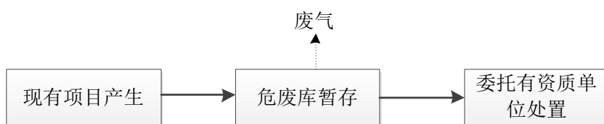
图 2-2 危险固废暂存库示意流程图