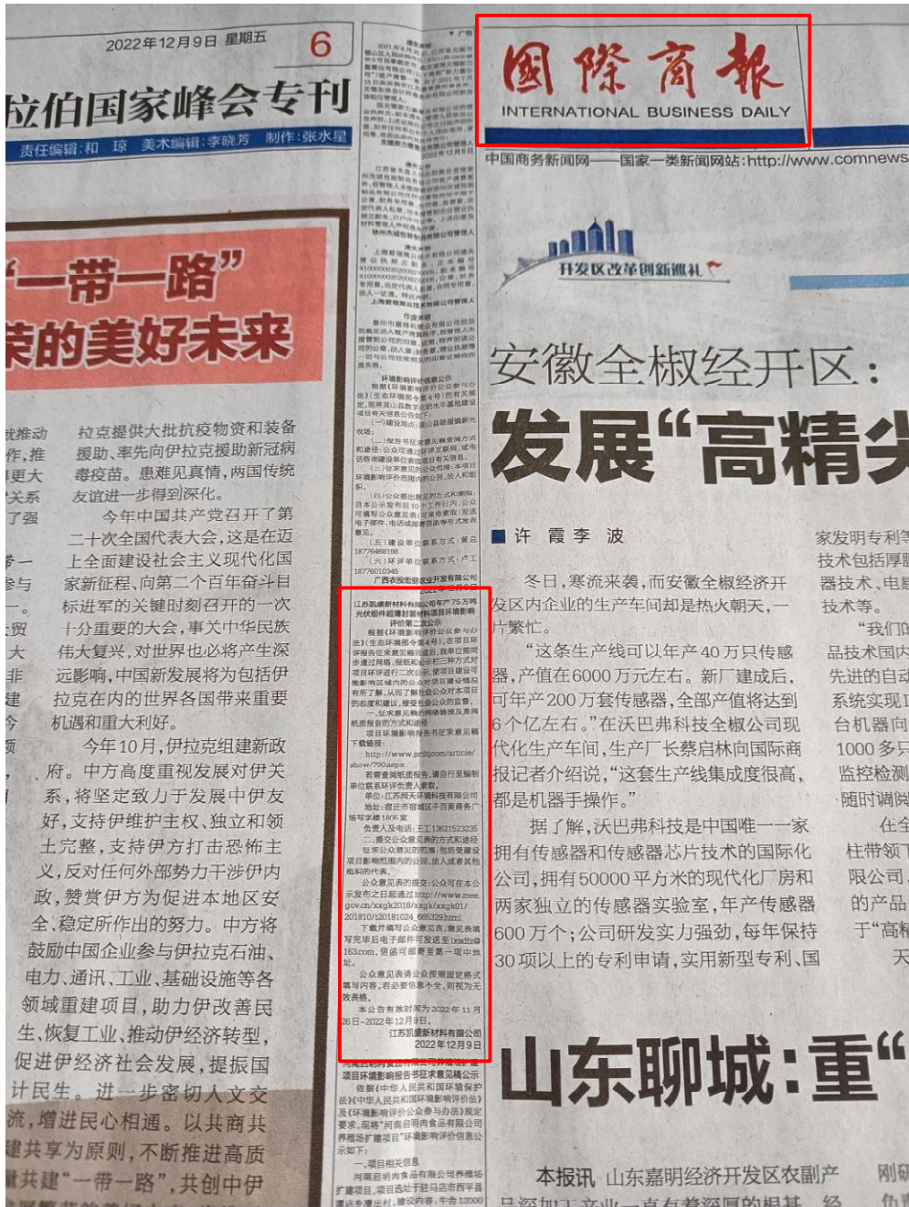
图 3-4 环评征求意见稿报纸公示截图（第二次报纸公示）