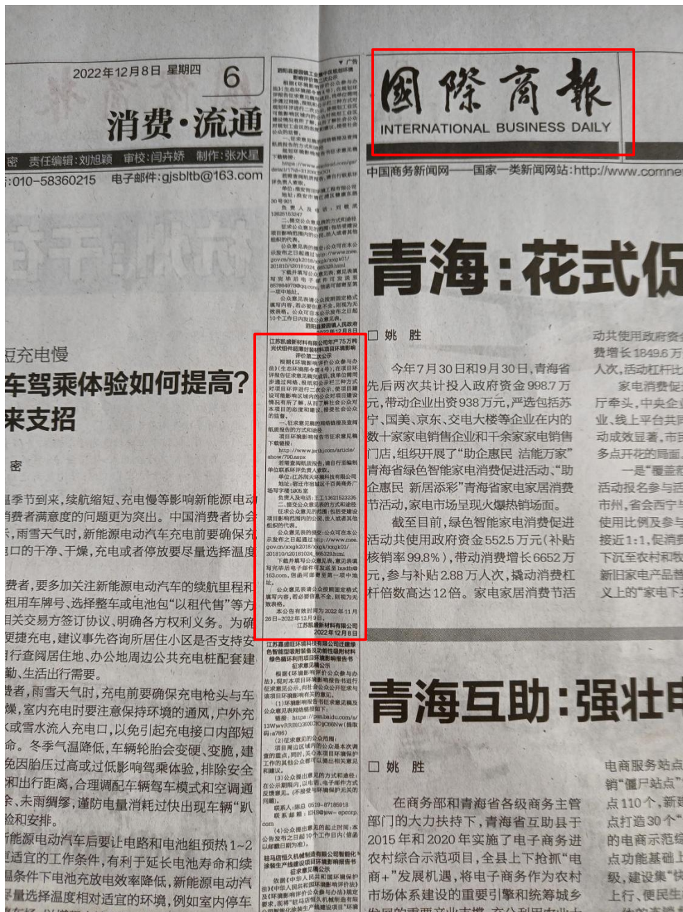
图 3-3 环评征求意见稿报纸公示截图（第一次报纸公示）

为提高本项目环境影响评价公众参与的广泛性、便利性、真实性，建设单位选取《国际商报》分别于2022年12月8日、12月9日进行环评信息公示，载体选取符合相关要求。