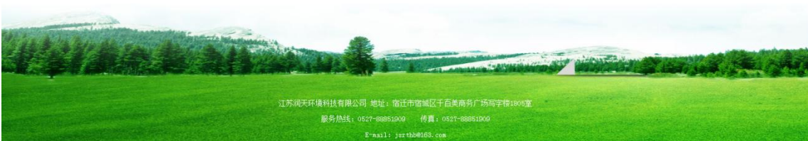
图 2-1 第一次网上公示截图