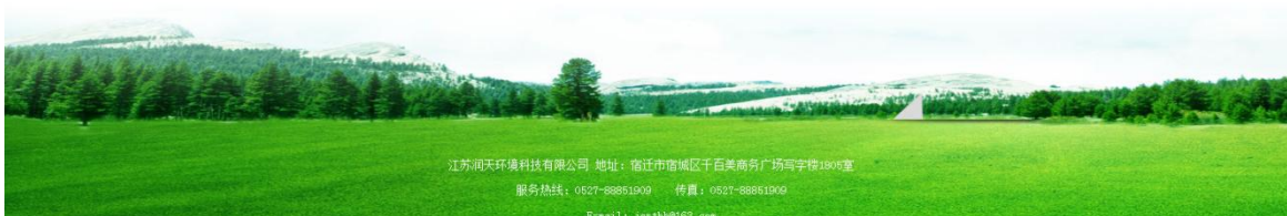
图 3-1 环境影响评价征求意见稿公示网页截图